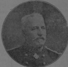
EL GENERAL DUHOS

Jefe del Estado Mayor del Ministerio de la Guerra de Francia, tiene a su cargo la movilización del Ejército y según la Prensa francesa está perfectamente preparado para hacer frente a cualquier situación.