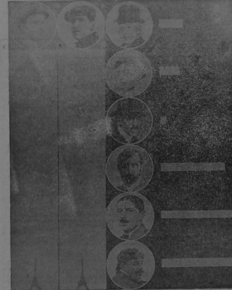
Los records de la altura en 1908 y 1909

Parte superior: a la izquierda, Wilbur Wright, campeón en 1908 con 75 metros; a la derecha Latham campeón en 1909 con 475 metros.